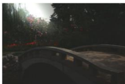
Efeitos de iluminação