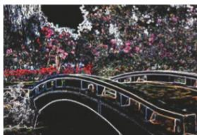
Deteção de bordas